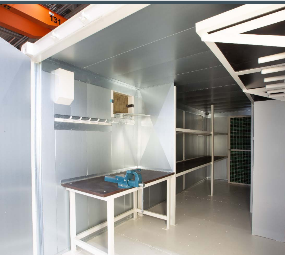
Travaux à l'abri des intempéries