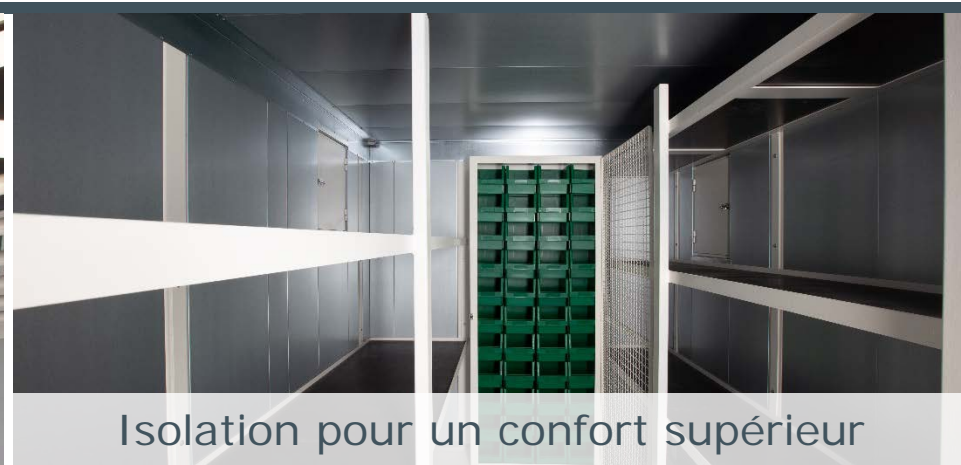
Isolation pour un confort supérieur