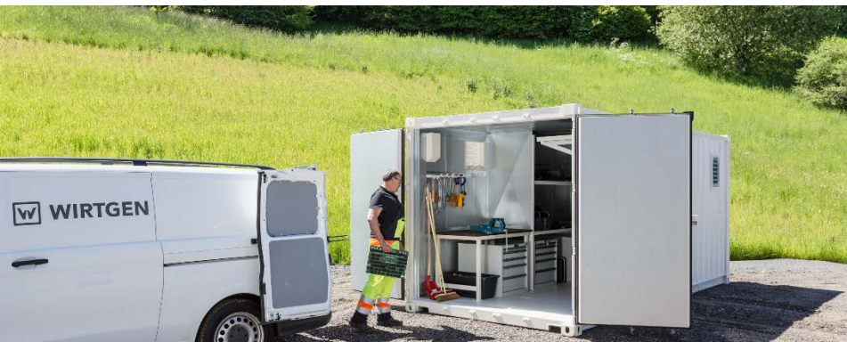
Volume : 33 m 3