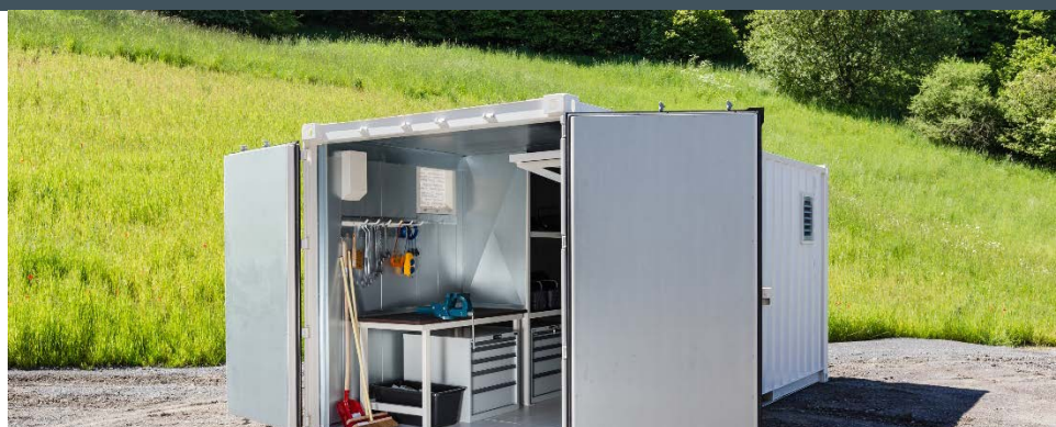
Dimensions ext. : 6 058x2 438x2 591 mm