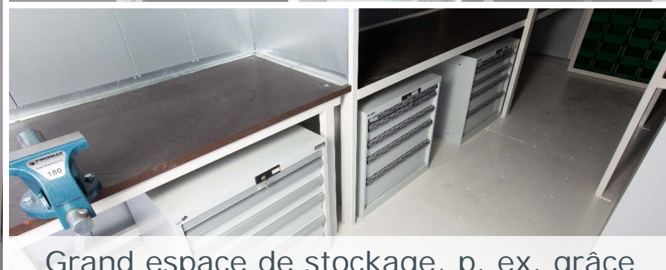
Grand espace de stockage, p. ex. grâce aux armoires à outils