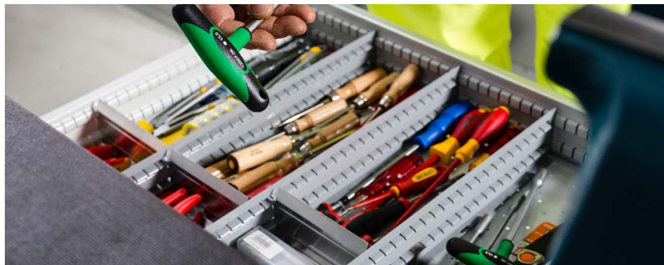
Plus de 27 000 pièces