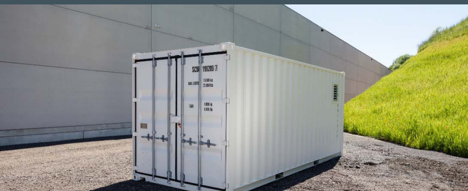
Conteneur 20 pieds